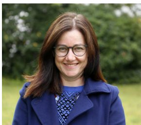
Tel. 0171 9750 557 oder palma.alblerheinhunsrueck.de